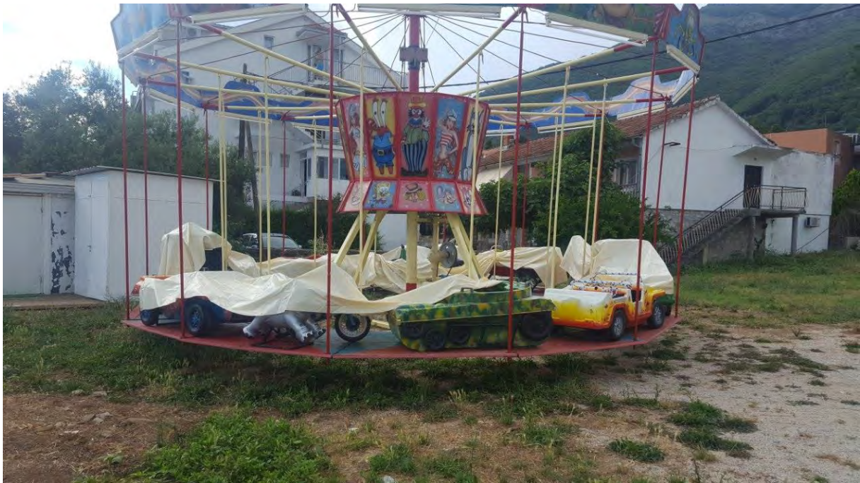
Slika 7 - oprema parka (dječiji mali ringišpil )