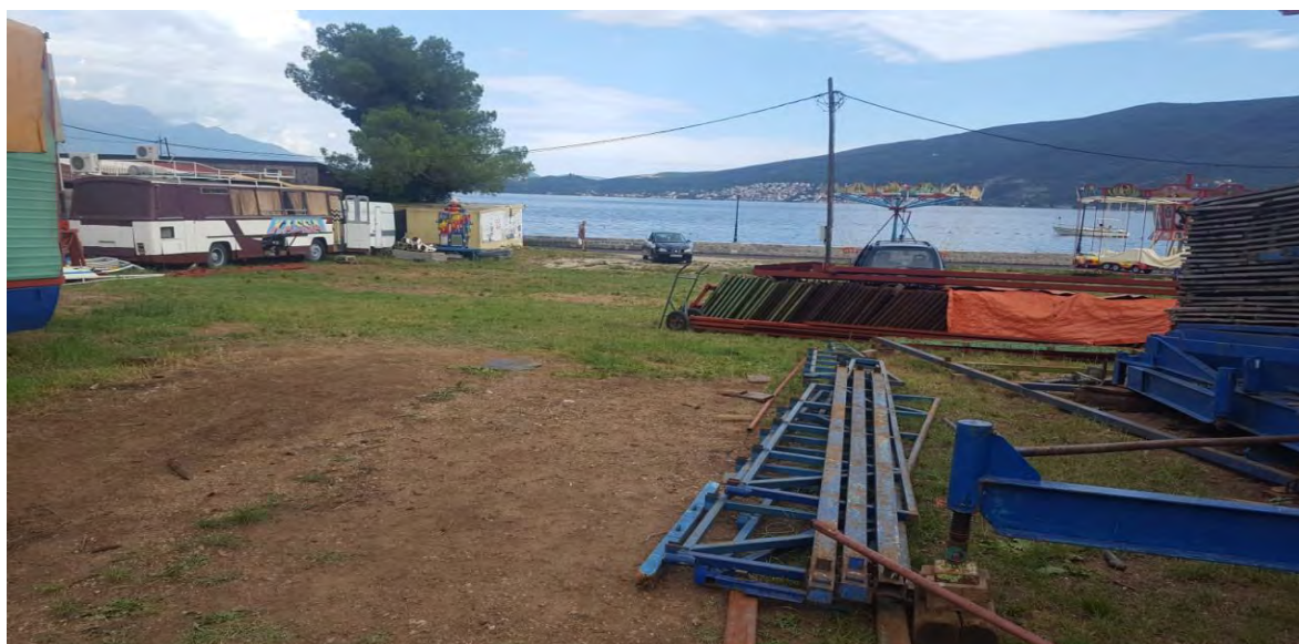
Slika 3 – pogled na šetalište i more