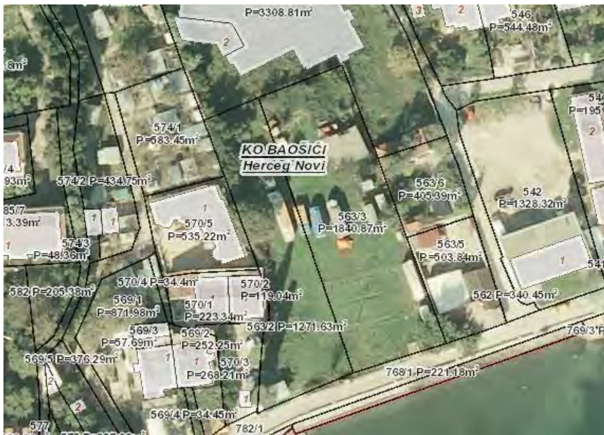
Kat.parc. br. 563/3 K.O.Baošići, P=1840,87 m2