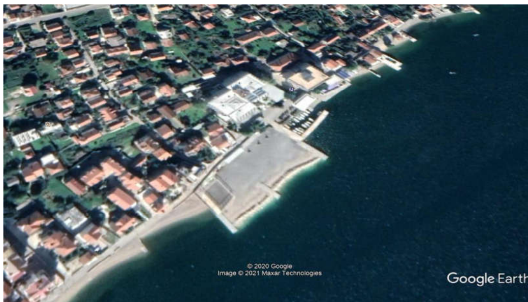
Slika 1. Šira lokacija predmetnog zahvata plaže uz hotel „Delfin“ U Bijeloj

Širi zahvat predmetne lokacije u Bijeloj, gdje je izgrađena plaža uz hotel „Delfin“ nalazi se u zahvatu katastarskih parcela 575 i 749 i dijelu kat. parcele 572, od njene zapadne granice, istočno do granice kat. Parcele 570 i 569. K.O. Bijela.