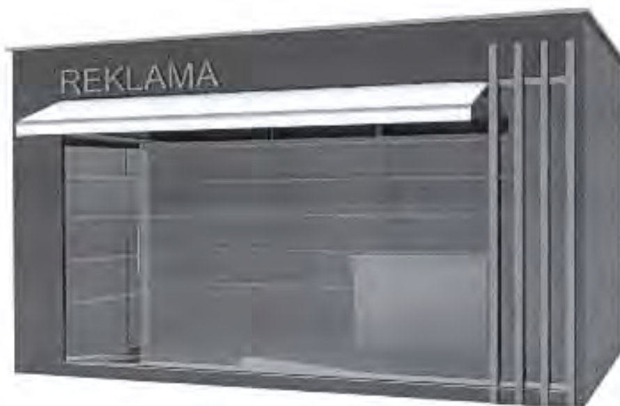
Kiosk površine do 12m 2 .

Opremu kioska obavezno čini korpa za otpatke postavljena neposredno uz kiosk ili iza kioska.