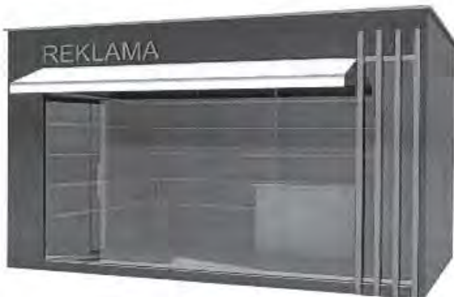
Kiosk površine do 12m 2 .

Opremu kioska obavezno čini korpa za otpatke postavljena neposredno uz kiosk ili iza kioska.