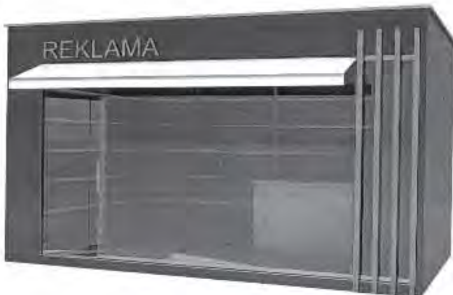
Kiosk površine do 12m 2 .

Opremu kioska obavezno čini korpa za otpatke postavljena neposredno uz kiosk ili iza kioska.