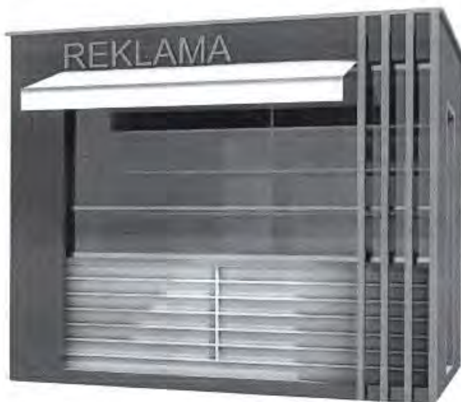
Kiosk od 9m 2

Opremu kioska obavezno čini korpa za otpatke postavljena neposredno uz kiosk ili iza kioska.