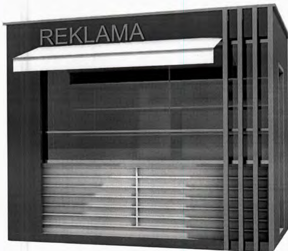
Kiosk od 9m 2

Opremu kioska obavezno čini korpa za otpatke postavljena neposredno uz kiosk ili iza kioska.