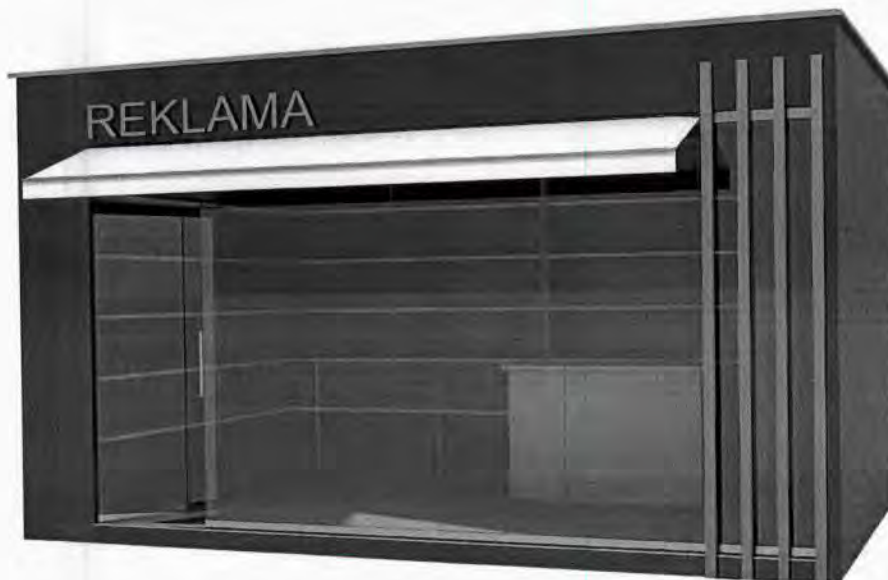
Kiosk površine do 12m 2 .

Opremu kioska obavezno čini korpa za otpatke postavljena neposredno uz kiosk ili iza kioska.