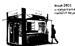
Kiosk 2600 u varijantama različitih boja

Kiosk može biti pravougaonog ili nepravilnog oblika. Konstrukcija može da bude od čelika pocinčanog i plastificiranog u boji, od inoxa ili od eloksiranog ili plastificiranog aluminijuma. Struktura fasada i zidova može biti od pocinčanih bojenih limova, poliuretanskih panela ili fasadnih laminata. Montira se na ravnu betonsku podlogu. Izbor boja u velikoj mjeri zavisi od ambijenta. Poželjne boje su bijela, antracit, tamno zelena (boja primorskog rastinja) inox, svjetlo siva.