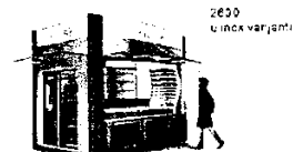
2600 u inox varijanti