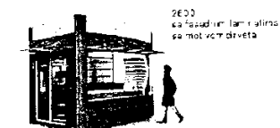
2600 sa fasadnim laminatima sa motvom drveta