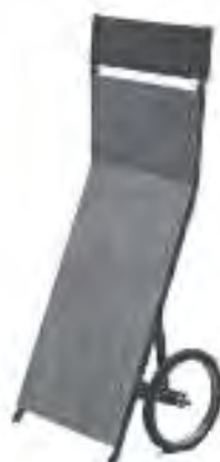
Izgled prodajnog pulta i prodajnog panoa