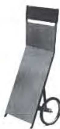
Izgled prodajnog pulta i prodajnog panoa.