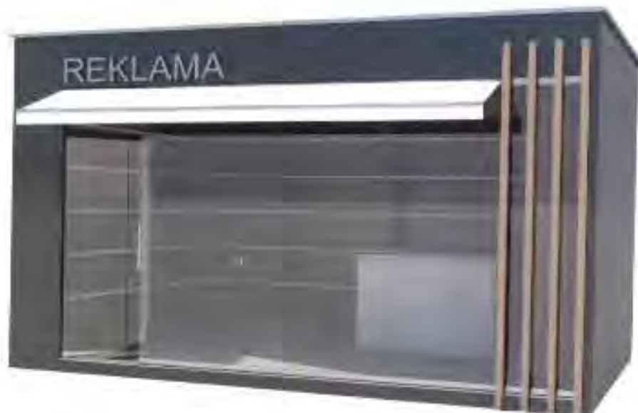
Kiosk površine do 12m 2 .

Opremu kioska obavezno čini korpa za otpatke postavljena neposredno uz kiosk ili iza kioska.