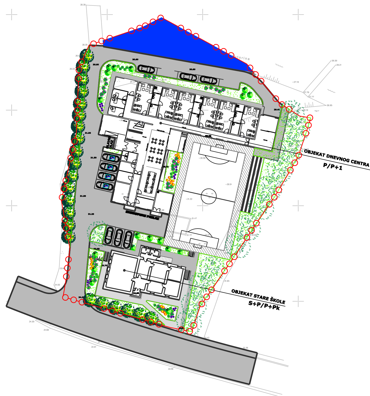
LEGENDA PROTIVPOŽARNIH SIMBOLA