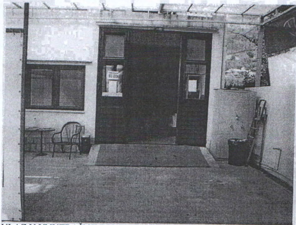
ULAZ U UNUTRAŠNJI DIO PRAONICE