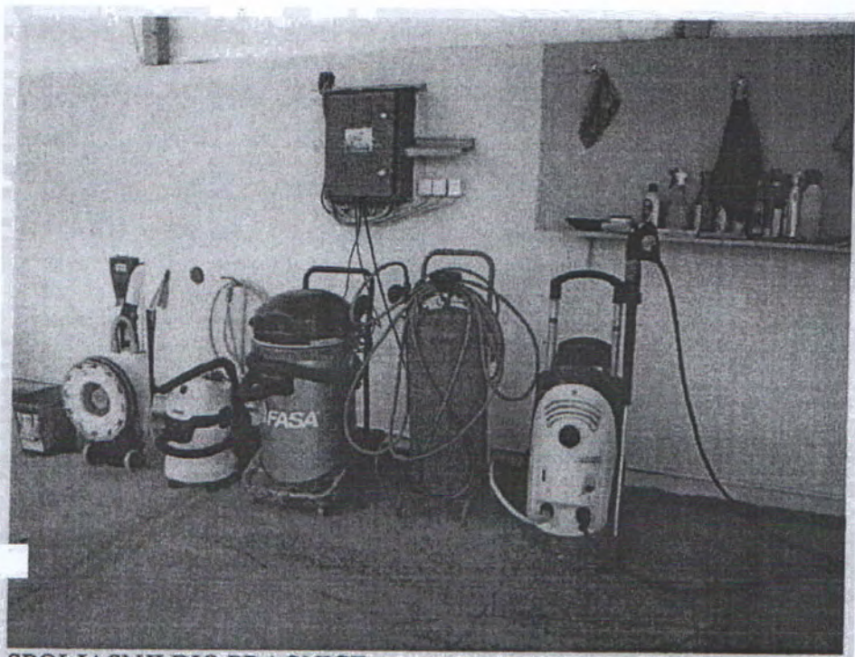
SPOLJASNI DIO PRAONICE