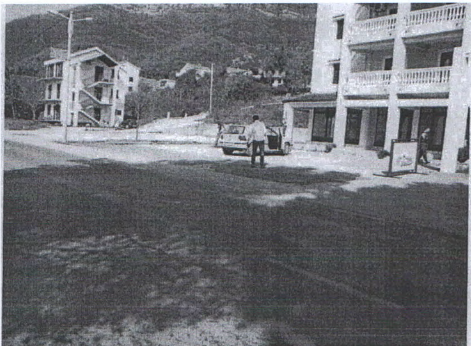
MAGISTRALNI PUT JADRANSKA MAGISTRALA ISPRED OBJEKTA