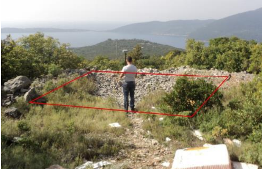
Slika 1. Izgled planirane lokacije „HN20 Klinci“

Na lokaciji “HN20 Klinci“ planirano je postavljanje telekomunikacione opreme GSM mreže preduzeća MTEL u Crnoj Gori radi pokrivanja signalom teritorije opštine Herceg Novi.