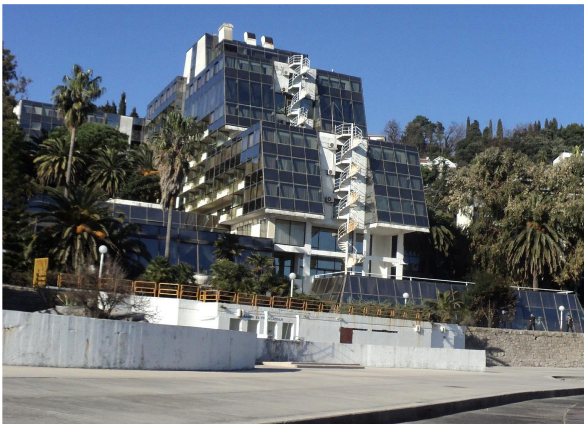
Slika 1. Izgled planirane lokacije „HN25 Hotel Plaža“

Na lokaciji „HN25 Hotel Plaža“ planirano je postavljanje telekomunikacione opreme GSM mreže preduzeća MTEL u Crnoj Gori radi pokrivanja signalom teritorije opštine Herceg Novi.