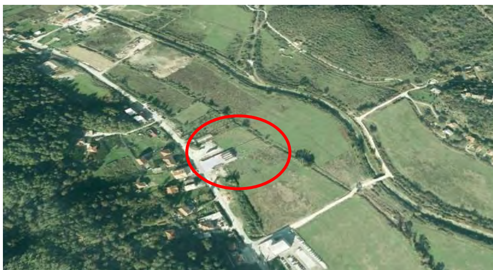
Slika 2. Vizura Sutorinsko polje, sa lokacijom k.p. 6007. (»Google Earth«)

Osjetljivost životne sredine u konkretnom području koje može biti izloženo negativnom uticaju projekata mora biti uzeto u obzir, a naročito u pogledu: